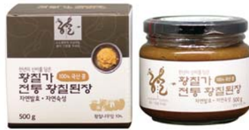
[황칠가] 전통 황칠된장