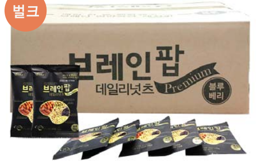
[황칠가] 브레인팝 데일리넛츠 • 25g / 100개입 - 벌크 86,400원