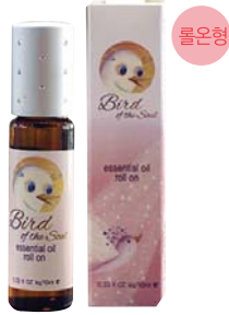
[HSP] 영혼의 새 에센셜 오일 29,000원 • 영혼의 향기 - 17가지 천연아로마오일