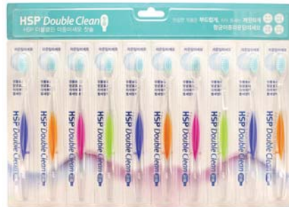
HSP 더블클린 이중미세모 칫솔 13,000원 • 10개입 / 치석제거 & 건강이