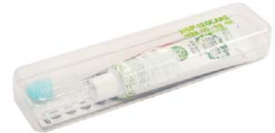
HSP 120 CARE 여행용 치약칫솔세트 3,700원 • 칫솔 2종류(이중미세모, 초미세모)