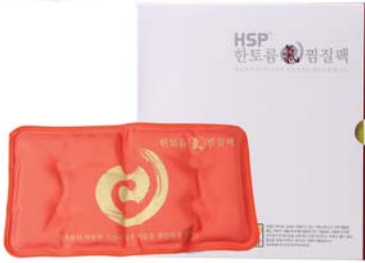
[한토름] 한토름 기(氣)찜질팩 38,000원 → 33,000원