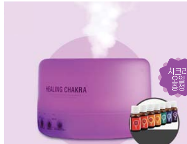
[HSP] 힐링차크라 LED램프 디퓨저 59,000원 • 500ml, 휴산기, 컬러테라피 / 아로마테라피 / 습도조절