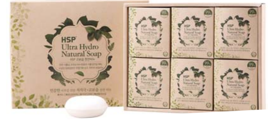
[HSP] 고보습 천연비누 13,200원 •100ml X 6개