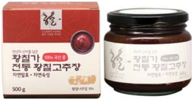
[황칠가] 전통 황칠고추장

대한민국 유기농 대모 전양순 명인이 직접 엄선한 농산물만을 가지고 전통 재래방식으로 만든 황칠가 정통 장은 안심하고 믿을 수 있으며 정성이 담긴 어머니의 손맛입니다.