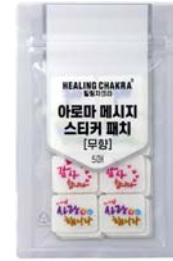
아로마 메시지 스티커 패치 • 무향 8개/5매 4,000원