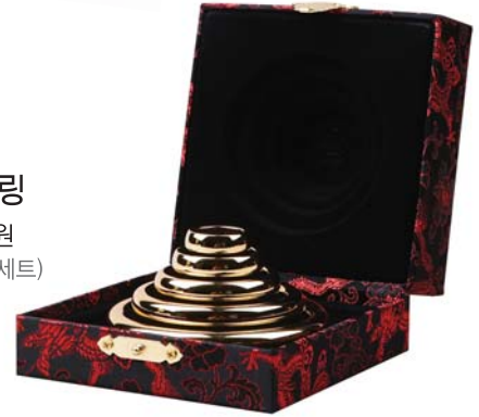
BHP 황금링 300,000원 • 천문명상(5P세트)