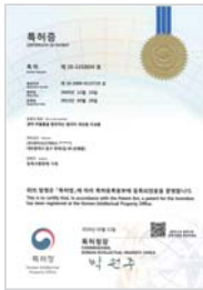
생약 추출물을 함유하는 알러지 개선용 조성물