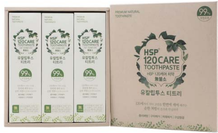
HSP 120 CARE 자연유래 치약 • 200g/단품 7,000원 • 세트(3개입) 21,000원