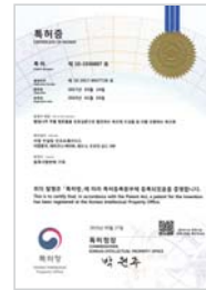
황칠나무 추출 발효물을 유효성분으로 함유하는 욕모제 조성물