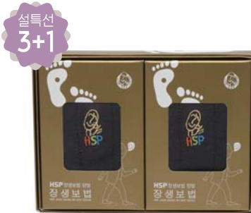
선택선 3+1 HSP 장생보법 양말세트 9,000원 • 남성용 / 진회색 2족 세트