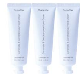
[황칠가] 세라마이드 덴트로파낙스 핸드크림 •1개 7,000원 •3개세트 19,000원