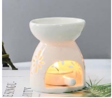
세라믹 아로마램프(꽃모양) • 8,900원

• 아로마 블렌딩세트 구입시 사은품 증정중입니다. • 아로마 에센셜오일 이벤트는 해피몰 사이트에서 확인 바랍니다.