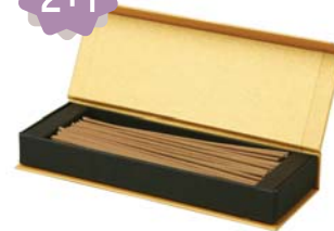
[향칠가] 향칠향기 35,000원 • 50g / 14cm / 120개 내외