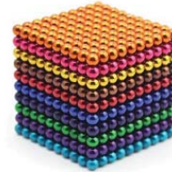
생명전자 구슬 35,000원 • 12가지 색 중 선택 / 5mm볼 125개 -스트레스 해소 / 두뇌개발