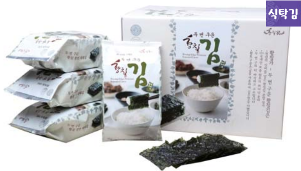
[황칠가] 천년의 신비 황칠김 • 26매 x 12봉 13,500원