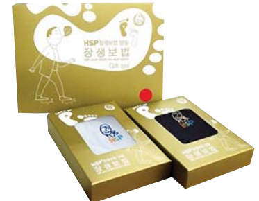
HSP 장생보법 양말세트 8,600원 • 여성용 / 롱밴드, 아이보리 남색 2족