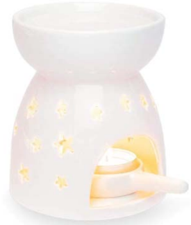
세라믹 아로마램프(별모양) 8,900원