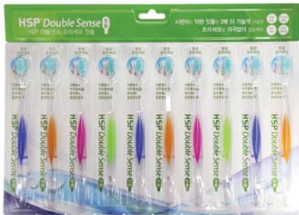
HSP 더블센스 초미세모 칫솔 13,000원 • 10개입 / 약한 잇몸 전용