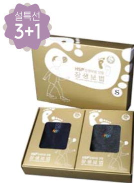
선택선 3+1 HSP 장생보법 양말세트 9,000원 • 남성용 / 네이비, 차콜 2중세트