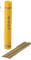
[향칠가] 향칠향기 미니 10,000원 • 지관통 / 14cm / 30개정도