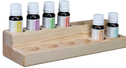
힐링차크라 원목전시대 • 2단 13구 20,000원 • 힐링차크라 10구/30구 캐리어(파우치) 12,000원