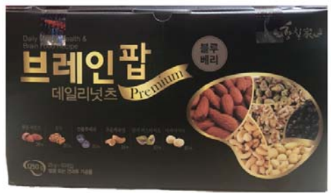
[황칠가] 브레인팝 데일리넛츠 • 25g / 50개입 48,000원