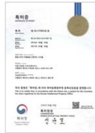
황칠나무의 추출물을 포함하는 조성물