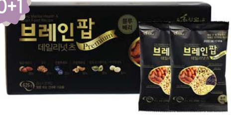
[황칠가] 브레인팝 데일리넛츠 • 25g / 25개입 - 1상자 24,000원