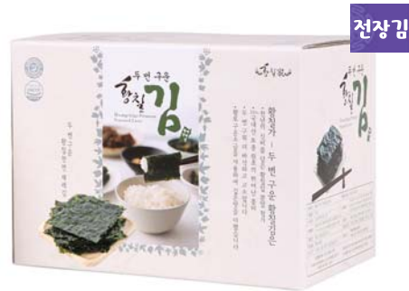
[황칠가] 천년의 신비 황칠김 • 22g 6매 x 10봉 15,000원