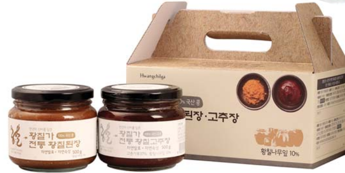
[황칠가] 전통 고추장된장 선물세트