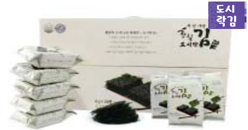
[황칠가] 천년의 신비 황칠김 • 4g x 36봉 16,500원