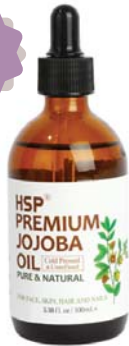
[HSP] 유기농 프리미엄 호호바 캐리어오일 35,000원 • 100ml