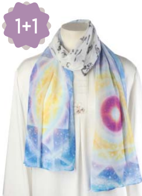
1+1 생명전자 천부경 스카프 20,000원