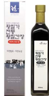
[황칠가] 전통 황칠간장