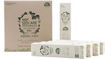
HSP 120 CARE 자연유래 치약 • 50g(휴대용)/단품 2,000원 • 세트(5개입) 10,000원