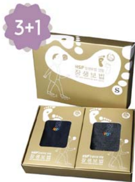
HSP 장생보법 양말세트 9,000원 • 남성용 / 네이비, 차콜 2중세트