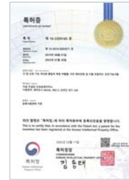
간 및 신장 기능 개선용 황칠계 복합추출물