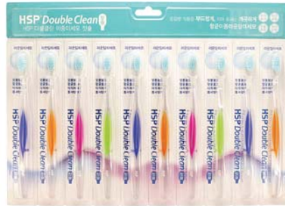
HSP 더블클린 이중미세모 칫솔 13,000원 • 10개입 / 치석제거 & 건강이