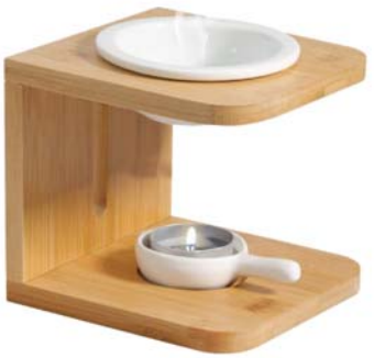
대나무 아로라램프 • 13,900원

오렌지 15,000원 레몬/레몬그라스 18,000원 유칼립투스 24,000원 페퍼민트 25,000원 자몽 27,000원 일랑일랑/제라늄 28,000원 라벤더/티트리/로즈마리 30,000원