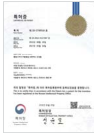
황칠나무의 추출물을 포함하는 조성물