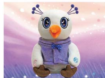
노래하고 말하는 영혼의 새 인형 39,000원 • 3개국어 가능