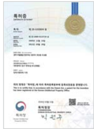
생약 추출물을 함유하는 알러지 개선용 조성물