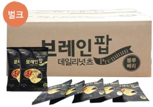
브레인팝 데일리넛츠 • 25g / 100개입 - 벌크 86,400원