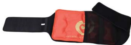
[한토름] 기(氣)찜질팩 벨트 30,000원