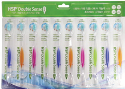
HSP 더블센스 초미세모 칫솔 13,000원 • 10개입 / 약한 잇몸 전용