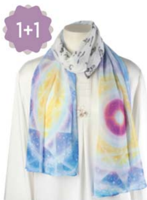
생명전자 천부경 스카프 20,000원