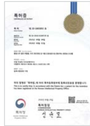
황칠나무 발효 추출물, 제조방법, 유효성분으로 함유하는 화장료 조성물