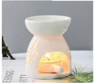
세라믹 아로라램프(꽃모양) • 8,900원

• 아로마 블렌딩세트 구입시 사은품 증정중입니다. • 아로마 에센셜오일 이벤트는 해피몰 사이트에서 확인 바랍니다.