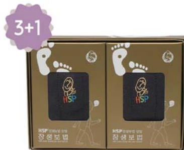
HSP 장생보법 양말세트 9,000원 • 남성용 / 진회색 2족 세트