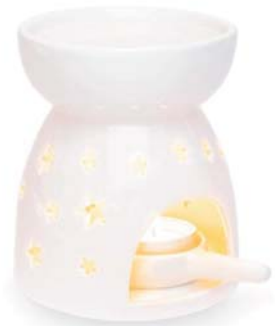
세라믹 아로라램프(별모양) • 8,900원