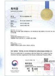
황칠나무와 미나리를 이용한 천연발효식초, 이의 제조방법 및 이를 포함하는 간 및 신장 기능 보호, 개선 건강식품