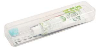
HSP 120 CARE 여행용 치약칫솔세트 3,700원 • 칫솔 2종류(이중미세모, 초미세모)