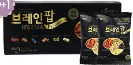
브레인팝 데일리넛츠 • 25g / 25개입 - 1상자 24,000원