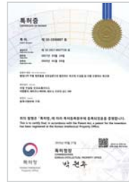
황칠나무 추출 발효물을 유효성분으로 함유하는 욱모제 조성물