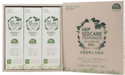
HSP 120 CARE 자연유래 치약 • 200g/단품 7,000원 • 세트(3개입) 21,000원