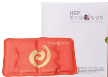
[한토름] 한토름 기(氣)찜질팩 38,000원 → 33,000원