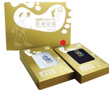
HSP 장생보법 양말세트 8,600원 • 여성용 / 롱밴드, 아이보리 남색 2족