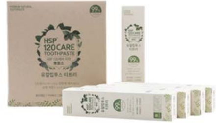
HSP 120 CARE 자연유래 치약 • 50g(휴대용)/단품 2,000원 • 세트(5개입) 10,000원