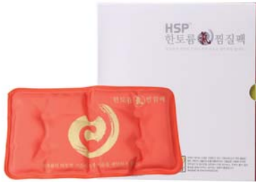
[한토름] 한토름 기(氣)찜질팩 38,000원 → 33,000원