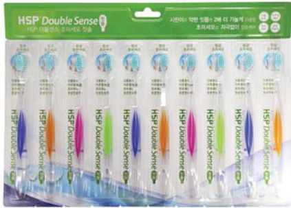
HSP 더블센스 초미세모 칫솔 13,000원