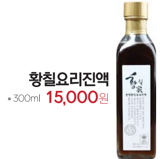
황칠오리진액 • 300ml 15,000원