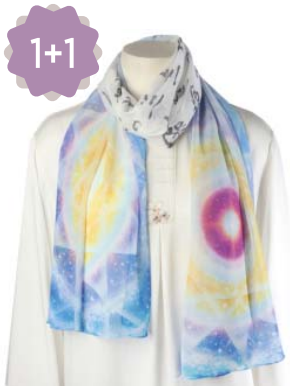
생명전자 천부경 스카프 20,000원