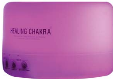
[HSP] 힐링차크라 LED램프 디퓨저