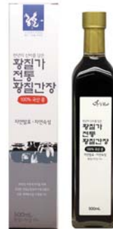
[황칠가] 전통 황칠간장 • 500g 15,000원 • 상자케이스 포함 15,500원