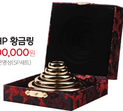
BHP 황금링 300,000원 • 천문명상(5P세트)