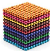
생명전자 구슬 35,000원

• 12가지 색 중 선택 / 5mm볼 125개 - 스트레스 해소 / 두뇌개발