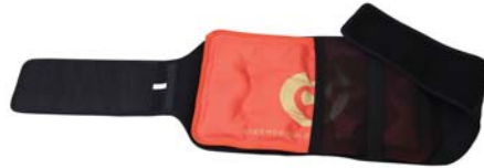
[한토름] 기(氣)찜질팩 벨트 30,000원