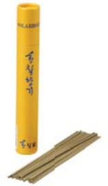
[황칠가] 황칠향기 미니