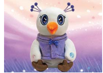
노래하고 말하는 영혼의 새 인형 39,000원 • 3개국어 가능