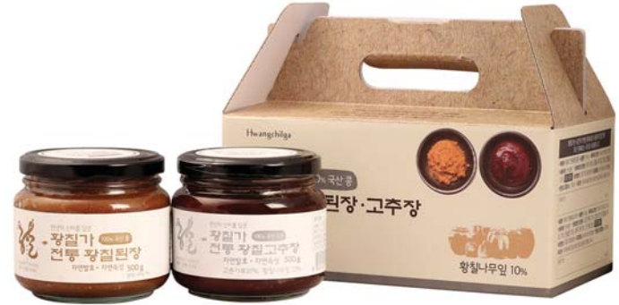
전통 고추장된장 선물세트 • 500g 40,000원