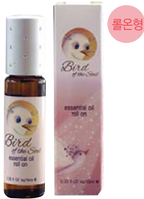
영혼의 새 에센셜 오일