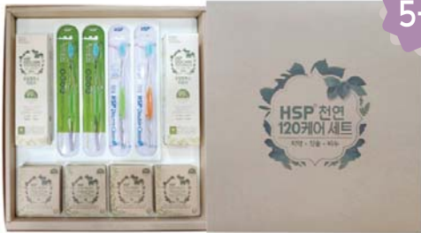
HSP 120 CARE 선물세트 30,000원