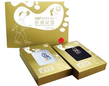
HSP 장생보법 양말세트 8,600원 • 여성용 / 롱밴드, 아이보리 남색 2족