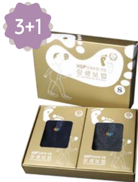
HSP 장생보법 양말세트 9,000원 • 남성용 / 네이비, 차콜 2중세트