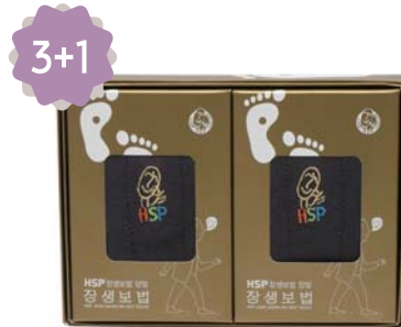
HSP 장생보법 양말세트 9,000원 • 남성용 / 진회색 2족 세트