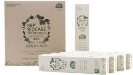
HSP 120 CARE 자연유래 치약