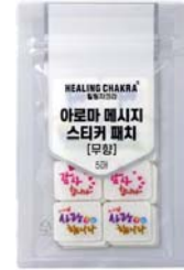
아로마 메시지 스티커 패치