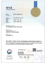
생약 추출물을 함유하는 알러지 개선용 조성물