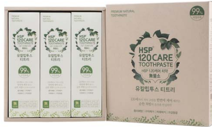
HSP 120 CARE 자연유래 치약