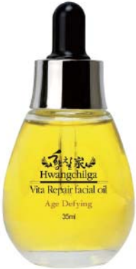
용량 : 35ml