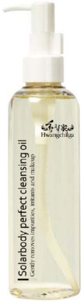
용량 : 300ml

발효 동백오일의 안전한 유성분 제거와 워시오프타입의 깔끔한 마무리감. 완벽한 세안을 위한 퍼펙트한 클렌징 오일