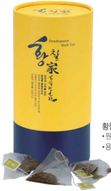
황칠천년차골드 • 원료 : 황칠나무잎 100% • 용량 : 36g (1.2g 삼각티백 × 30개)