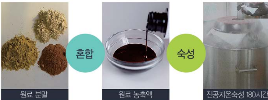
신명제조법은 꿀에 분말 원료를 혼합하는 단순제조법과 비교됩니다

신명 제조법은 원재료의 반은 분말화하고, 반은 추출농축하여 유용성분의 함량을 배로 높입니다. 이 고농축액과 분말을 혼합한 후, 180시간 동안 진공저온 숙성시켜 소화 흡수율과 유효 함량을 월등히 높였습니다.