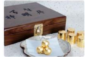
황칠신명단 골드 (30환)