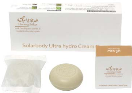
상품구성 : 100ml X 3개

조밀하고 풍부한 거품으로 피지와 노폐물 제거 피부장벽은 보호하고 피지와 노폐물은 제거하는 하이드로 크림 슝