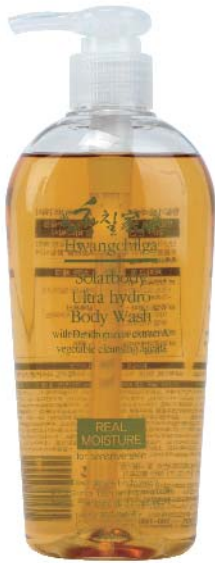
용량 : 300ml