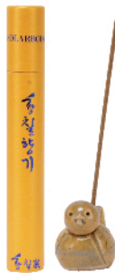
황칠향기 (미니 휴대용지관통, 약 30개)