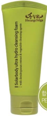
용량 : 100ml