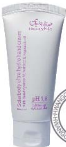
용량 : 50ml

보들 보들 아기피부로 돌아가는 산뜻 · 촉촉 · 건강한 손을 위한 필수품!