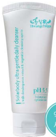
용량 : 100ml

자극에 민감한 피부를 위한 특별한 선택! 민감한 피부를 위한 저자극 약산성 클렌저(pH5.5±2)