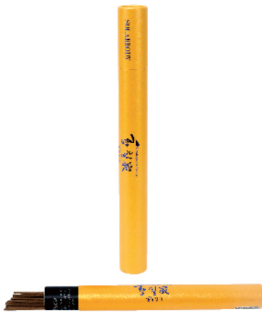
황칠향기(장형 지관통, 약 50g/70개)

황칠향기의 안식향은 인류의 마지막 향이라고 해도 과언이 아닐 정도로 우리 신경에 안정감을 주고 건강에 도움이 되는 향입니다. 황칠향기는 심신의 균형을 잡아주고 긴장을 풀어주고 기분이 좋아지도록 도움을 줍니다.