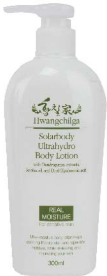
용량 : 300ml

민감하고 연약한 피부의 아이부터 어른까지 온가족マイルド 바디로션 무늬만 보습성분이 아닌 리얼보습성분