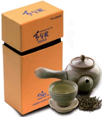
황칠천년차 • 원료 : 황칠나무잎 100% • 용량 : 40g

황칠 자생지 보길도를 중심으로 우리나라 남쪽지역에서 자라는 최상급의 원초를 사용하였으며 오랜 기간 황칠을 연구한 황칠 명인의 손끝에서 정성스런 수작업으로 만들어져 아름다운 황금빛과 부드럽고 깊은 맛이 뛰어나며 황칠의 고유한 성분이 고스란히 담겨있는 명품차입니다.