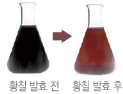
황칠 발효 전 황칠 발효 후

황칠발효 신소재 연구 개발 및 세계최초 ICID등재 국제뇌교육종합대학원대학교 융합생명과학과, 한국식품연구원(KFRI) 자생 황칠나무 잎/줄기를 황칠 발효에 최적화된 '국제뇌교육종합 대학원대학교 융합생명과학과'의 기탁균주 "락토바실러스 일지황칠 2020" 유산균으로 발효한 피부 자생에 유용한 원료입니다.